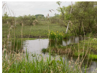
Marais de Sacy le Grand

Le dimanche, changement de décor, c'est du village de Labruyère que vous entamerez votre randonnée. Après un passage sur la Montagne de Rosoy, direction les Marais de Sacy où nous vous proposerons une courte visite de ce site protégé. Ensuite, route vers Angicourt pour le pique-nique. L'après-midi vous rejoindrez les berges de l'Oïse à Rieux et par le chemin de halage vous regagnerez Creil. Au long de la rivière vous pourrez vous rendre compte du