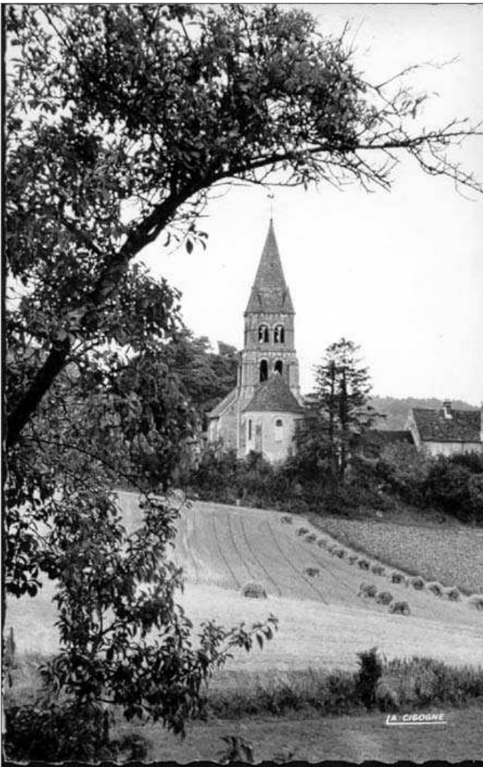
L'église de Saint Vaast de Longmont.

Datant pour l'essentiel du XII e siècle, l'église a connu quatre périodes de construction entre les années 1100 et 1170 environ. Elle est remarquable par son portail occidental à gâble et par son clocher, l'un des plus beaux de l'Oïse, tant par ses proportions que par sa décoration.