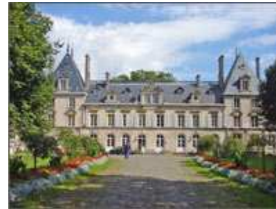
Château d'Aramont Verberie

Cette année nous vous proposons le samedi une randonnée dans la vallée de l'Oïse et de l'Automne, de Pontpoint à Béthisy Saint Pierre, en cheminant sur le GR 12. Après un passage à Verberie, vous pique-niquerez à Saint Vaast de Longmont avec son église du XII ème . Vous finirez votre journée au Château de la Douye, à Béthisy Saint Pierre.