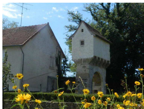
Sur la route de Gramat un pigeonnier

Cette semaine laissera aussi le souvenir de randonnées hautes en dénivelés dans une ambiance bon enfant.